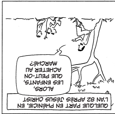
Petite leçon de grande importance

Écoutez bien, chers enfants, c'est très important! nous. Jésus Christ est descendu du ciel et il a donné sa vie en sacrifice sur la croix pour te délivrer de tes péchés si tu crois en lui. Un esclave, c'est quelqu'un, qui est enchaîné et qui n'arrive pas à se libérer lui-même. Imaginez qu'un homme riche dépense tout ce qu'il a dans le but d'acheter des esclaves et de les libérer de leur méchant maître. Ce serait difficile à croire, n'est-ce pas? Et pourtant, c'est exactement ce que le Seigneur Jésus a fait pour chacun d'entre tard à l'enfer.